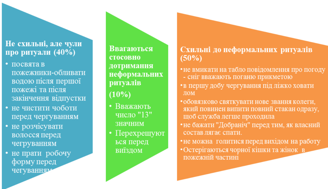
Рис. 1. Схильність до неформальних ритуалів у підрозділах МНС

За результатами методики «Матриці Равена», яка призначена для визначення рівня інтелекту особистості було виявлено, що 50% респондентів з підгрупи, що схильні до використання неформальних ритуалів мають середній рівень інтелекту на відміну від першої, респонденти якої мають рівень інтелекту вище середнього та високий рівень (див.рис.2)