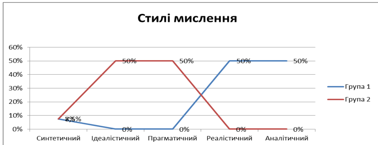
Рис. 3. Розподіл респондентів за стилями мислення за методикою «5 стилів мислення»

Завдяки аналізу методики діагностики «5 стилів мислення», було виявлено, що група респондентів, які схильні до неформальних ритуалів мають нахили до прагматичного та ідеалістичного стилю мислення (див. рис. 3)